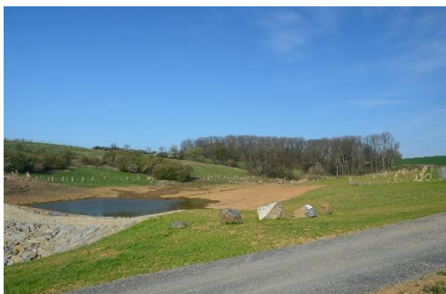
Pohled na N2, počátek napouštění, oplocenky s výsadbou zeleně

Při výstavbě byly účelně využity dotační zdroje a výsledek bude po mnoho let svědkem toho, že je lze uplatnit smysluplně na rozdíl od některých „měkkých projektů“, které jsou černou dírou pro nesmyslné utrácení s velmi krátkodobým efektem a téměř nulovou trvanlivostí. Obec Hradčany může být hrdá na účelné čerpání dotací, což je vidět na vybavenosti obce a vysoké rozpracovanosti dalších stavebních akcí. Laťka je nastavená vysoko a snad se podaří i v budoucnosti tento trend udržet.