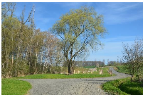
Komunikace pod hrází N2 na místě bývalé bažiny

N2 – bezejmenný pravostranný přítok Šišemky z lokality Debřa. Šířka hráze v koruně 3 m, délka hráze 81,8 m, max. výška hráze 5,8 m, max. plocha hladiny 18.920 m 2 , objem 43.400 m 3 , kóta koruny hráze 259,3 m n.m.